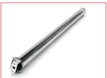
quemador lineal. Llama sencilla o llama doble