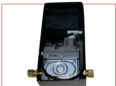
electroválvula de seguridad