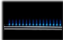
LLAMA AZUL QUEMADOR