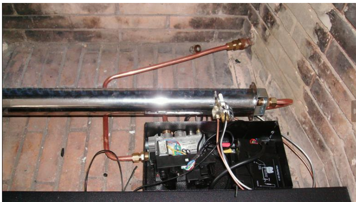
Figura ejemplo de ensamble de la chimenea y elementos